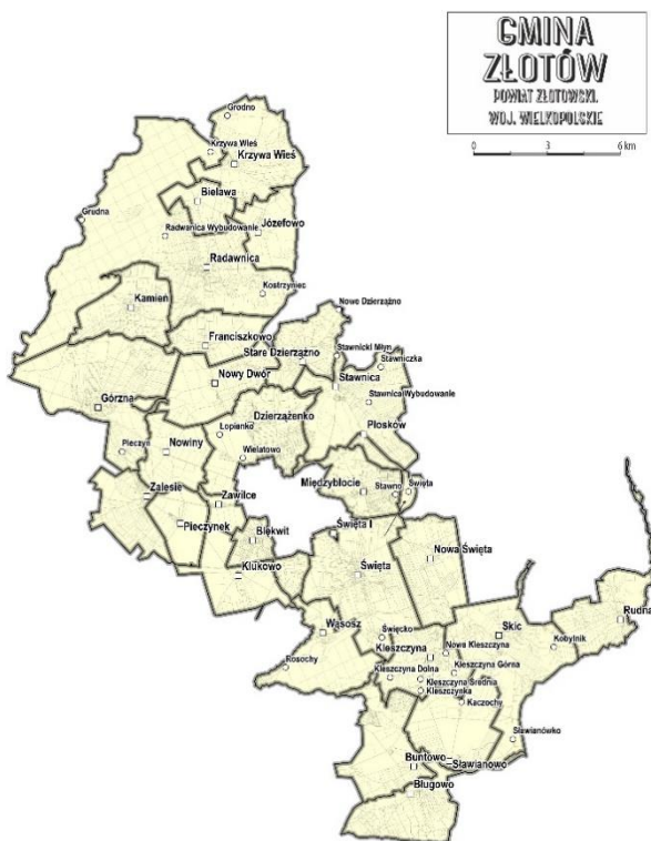
Rys. 2 Miejscowości w gminie Złotów.

Wyznaczając obszar na terenie gminy Złotów jednostką analityczną jest miejscowość i dla nich zostały wykonane wszystkie analizy.