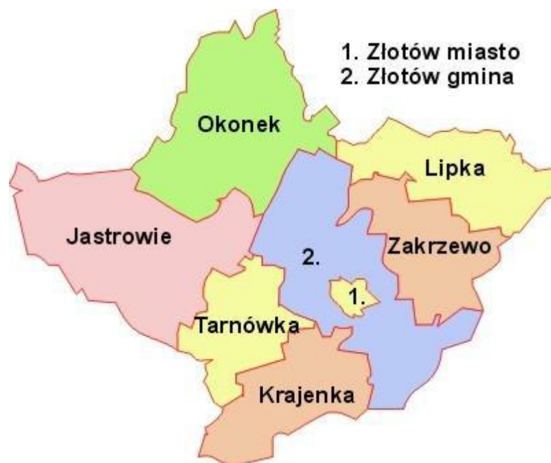
Rys. 1 Położenie gminy Złotów na tle powiatu złotowskiego.

Gmina Złotów jest gminą wiejską położoną w północnej części województwa wielkopolskiego, w powiecie złotowskim. Sąsiaduje z 8 gminami: od północy z gminą Okonek, od północnego wschodu z gminą Lipka, od wschodu z gminą Zakrzewo, od południa z gminami Łobżenica, Wysoka i Krajenka, od zachodu z gminami Jastrowie i Tarnówka oraz centralnie z gminą miejską Złotów.